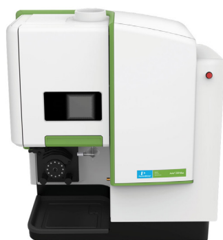
ИСП-ОЭС Avio 220 Max

От холодного запуска до анализа всего за 10 минут: система «Plug-and-play» спектрометра Avio 220 Max отличается самым быстрым запуском, что позволяет экономить ваше время и эксплуатационные расходы с возможностью выключения прибора в перерывах между проведением анализов. Кроме того, прибор потребляет примерно половину аргона по сравнению с конкурирующими системами.