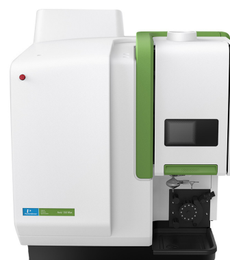
ИСП-ОЭС Avio 550 Max

Спектрометры Avio 550/560 Max идеально подходят для лабораторий с высокой требуемой производительностью и производственных QA/QC лабораторий. Система Avio 560 Max отличается от Avio 550 Max наличием встроенного модуля высокопроизводительной системы ввода проб HTS (High Throughput System), который обеспечивает максимальную производительность за счет значительного сокращения времени, необходимого для подачи раствора пробы, стабилизации и промывки системы ввода. Они обеспечивают самый низкий расход аргона среди ИСП - как минимум на 50% ниже, чем у конкурирующих систем.