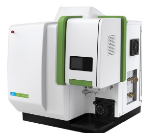
ИСП-ОЭС Avio 550 Max

Более того, эти системы могут использовать вдвое меньше аргона по сравнению с конкурирующими ИСП-системами. Функционально приборы не требуют частого обслуживания, обеспечивают максимальное время безотказной работы и исключительную производительность независимо от рабочей нагрузки. И все это с улучшенным пользовательским интерфейсом Syngistix™, представляющим собой интуитивно понятную интеллектуальную среду для диагностики прибора в реальном времени и просмотра результатов анализа проб, поведения внутреннего стандарта и образцов контроля качества, чтобы гарантировать точность определения элементов.